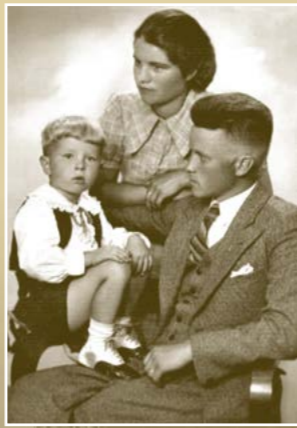
“Vanagu ligzda” 1936. gadā.