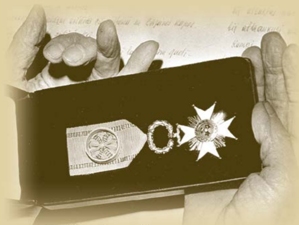
Triju zvaigžņu ordenis manās rokās.