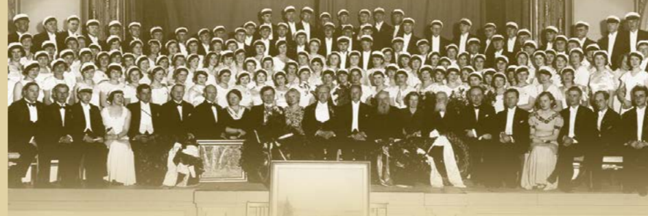
Izturēju Veļupes melnumu Sibīrijā (1941–1957) un atgriezos.