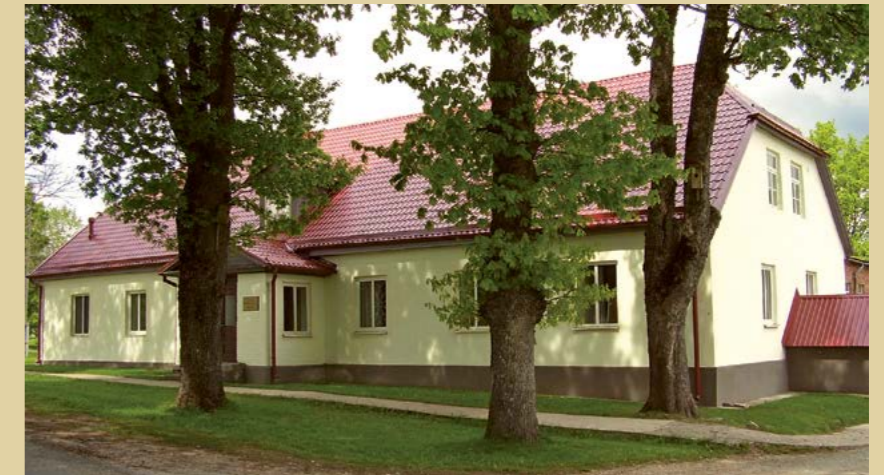
Amatas (bij. Spāres - Doles, Rencēnu) pamatskola – Melānijas Vanagas pirmā skola